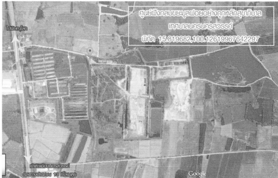
ภาพแสดงภาพถ่ายดาวเทียมบริเวณบ่อฝังกลบเทศบาลนครนครสวรรค์

ที่ตั้งโครงการตั้งอยู่บริเวณพื้นที่ ต.บ้านมะเกลือ อ.เมือง จ.นครสวรรค์ หรือเอกชนจะทำนอกพื้นที่ให้ แจ้งให้เทศบาลทราบเพื่อพิจารณาด้วย