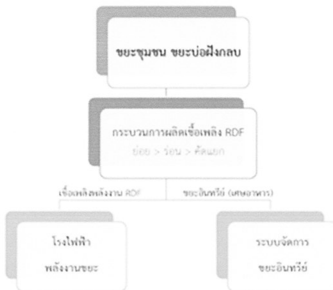
ภาพแสดงกระบวนการแปลงขยะเป็นเชื้อเพลิงพลังงาน